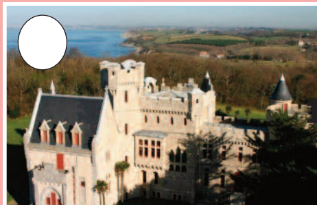
1. Abadia jauregia (Hendaia)