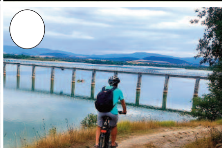
5. Ulibarri-Ganboako urtegia (Legutio ondoan)