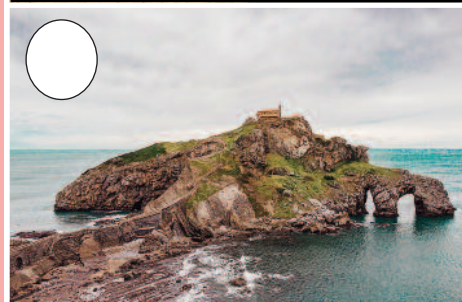
4. Gaztelugatxe (Bakiotik Bermeorako bidean)