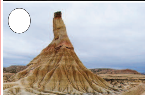
7. Erregeren Bardea (Tuteratik Cadreitarako bidean)