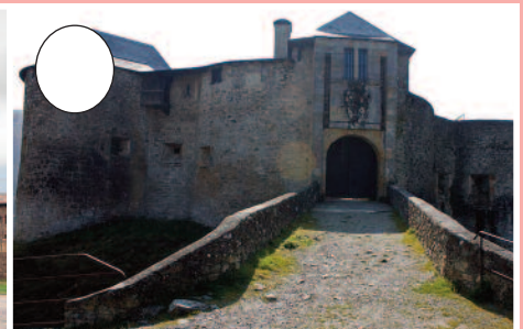
3. Gaztelu Zaharra (Maule-Lexarre)