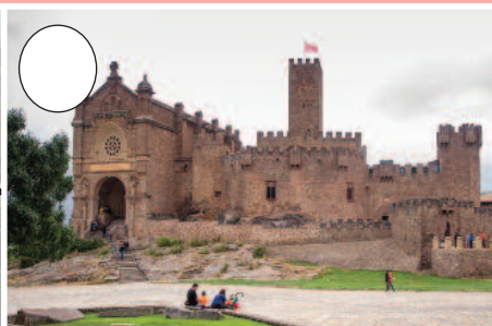
2. Xabierko gaztelua (Zangozako merindadea)