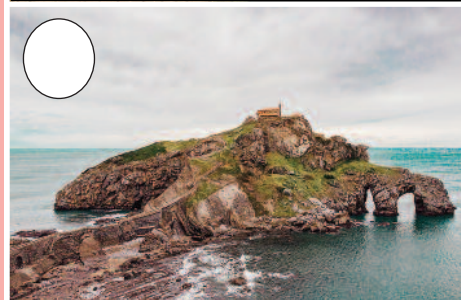
4. Gaztelugatxe (Bakiotik Bermeorako bidean)