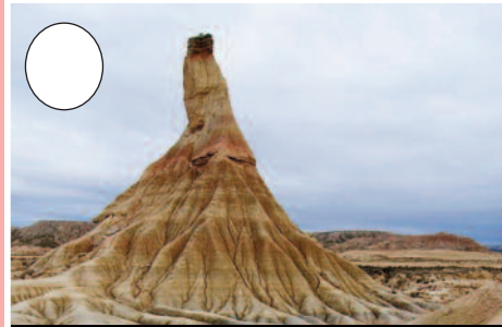
7. Erregeren Bardea (Tuteratik Cadreitarako bidean)