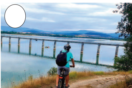
5. Ulibarri-Ganboako urtegia (Legutio ondoan)