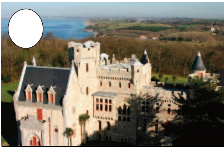
1. Abadia jauregia (Hendaia)