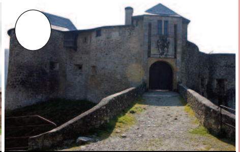
3. Gaztelu Zaharra (Maule-Lexarre)