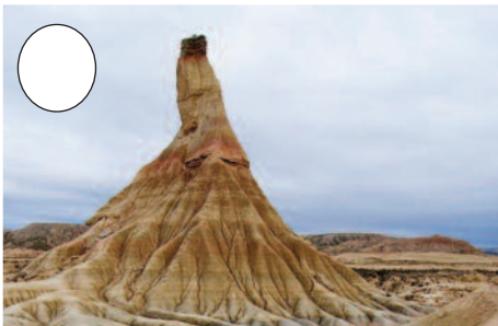
7. Erregeren Bardea (Tuteratik Cadreitarako bidean)