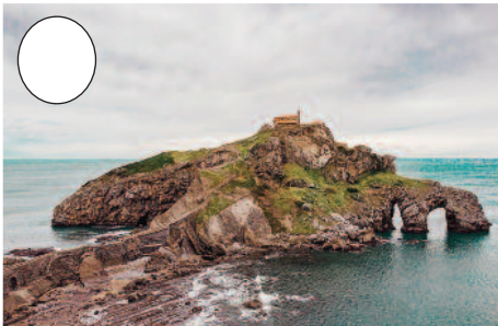
4. Gaztelugatxe (Bakiotik Bermeorako bidean)