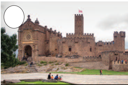
2. Xabierko gaztelua (Zangozako merindadean)