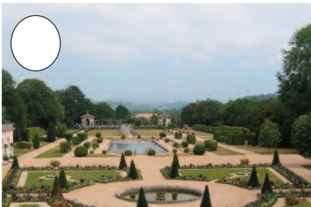
8. Arnagako lorategiak (Kanbo)