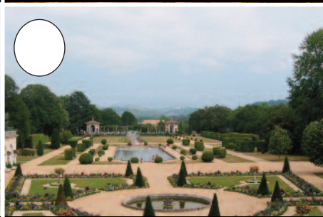
8. Arnagako lorategiak (Kanbo)