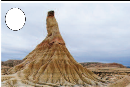
7. Erregeren Bardea (Tuteratik Cadreitarako bidean)