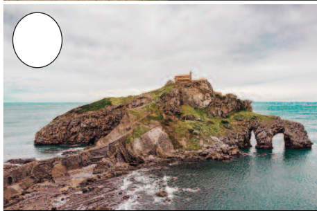
4. Gaztelugatxe (Bakiotik Bermeorako bidean)