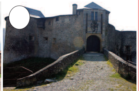
3. Gaztelu Zaharra (Maule-Lexarre)