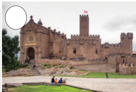
2. Xabierko gaztelua (Zangozako merindadean)