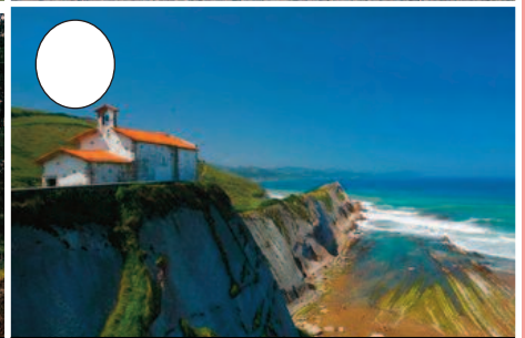
6. Itzurun hondartza (Zumaia)