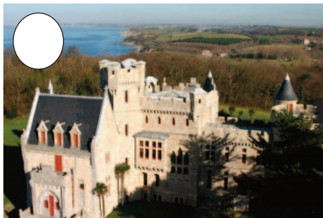
1. Abadia jauregia (Hendaia)