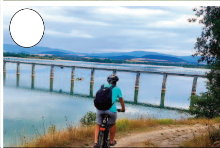
5. Ulibarri-Ganboako urtegia (Legutio ondoan)