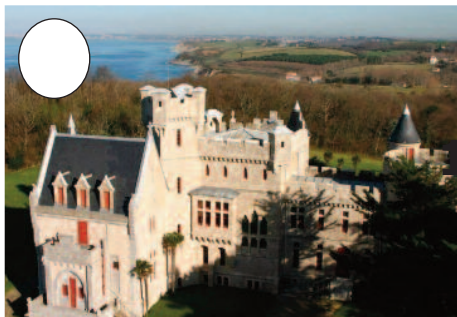
1. Abadia jauregia