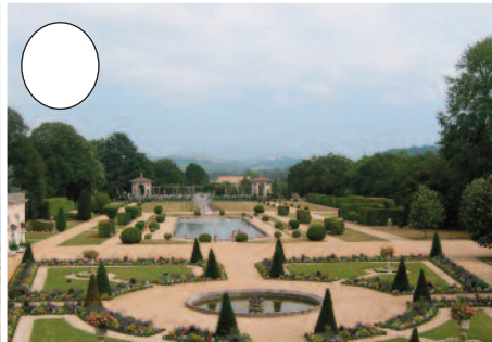
8. Arnagako lorategiak