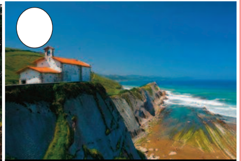
6. Itzurun hondartza