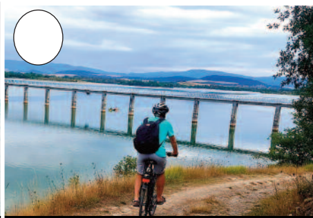
5. Ulibarri-Ganboako urtegia