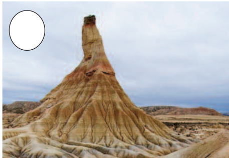
7. Erregeren Bardea